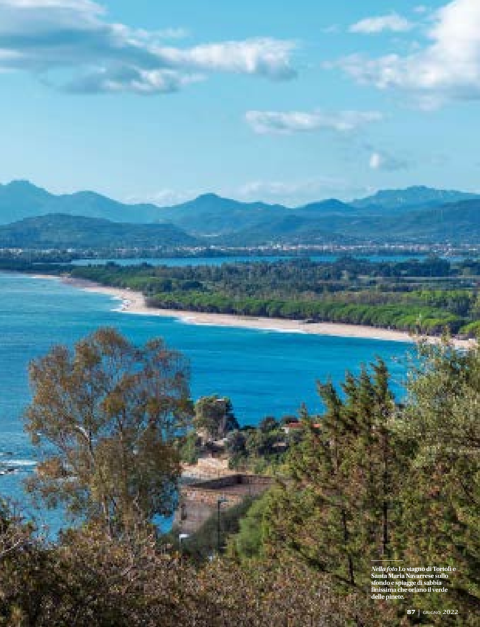
Nella foto Lo stagno di Tortoli e Santa Maria Navarrese sullo sfondo e spiagge di sabbia finissima che orlano il verde delle pinete.