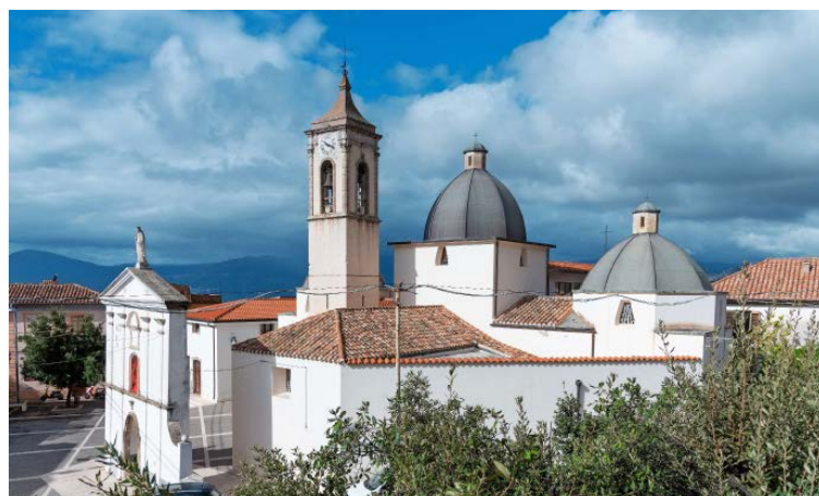
In alto La chiesa di San Nicola a Baunei.

Le capre selvatiche sono protagoniste del territorio al punto che Baunei ne ha fatto un emblema. Il paese negli ultimi anni ha visto aumentare i visitatori e l’offerta si è raffinata. Lungo l’Orientale sarda si trovano negozi come Dispensa 125 , che prende il nome dalla strada e promette “il segreto della longevità”. Una piccola bottega con selezioni accuratissime di formaggi, salumi, dolci, miele, vini, da degustare nella mini-cantina. L’insegna della capra compare nel vicino caffè-pizzeria Baunei (punto d’incontro di sportivi e fla-