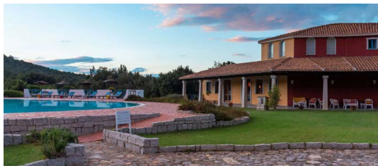
In foto La piscina dell'Hotel Orlando, nel verde del bosco di Santa Barbara a Villagrande Strisaili.

Straordinari gelati a base di latte di capra, circa 60 gusti: da provare il tiramisù, che