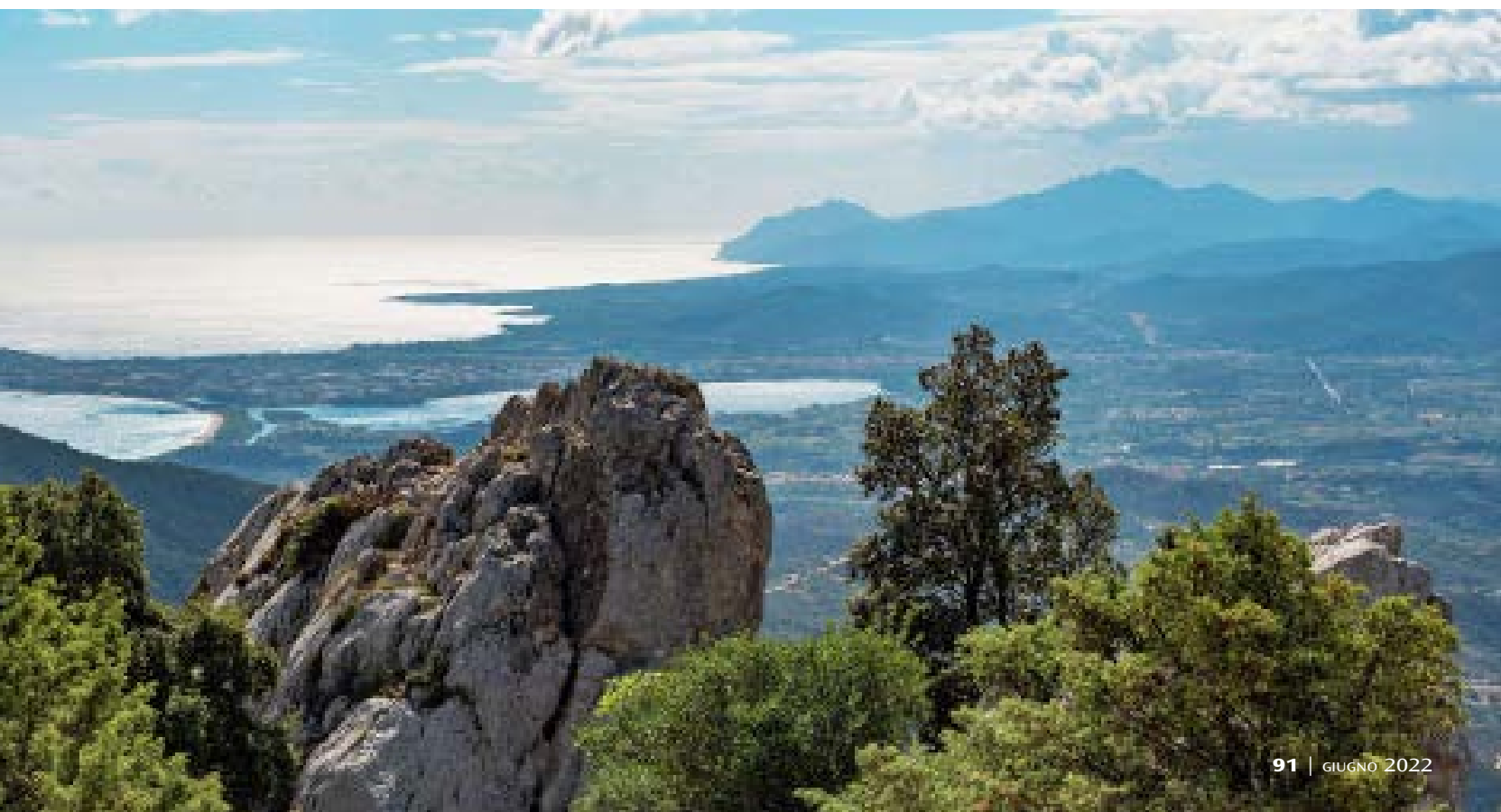
Nella foto sotto La vista strapitosa di Santa Maria Navarrese e dello stagno di Tortolì che si gode da un belvedere del Supramonte lungo la strada che porta a Petra Longa .