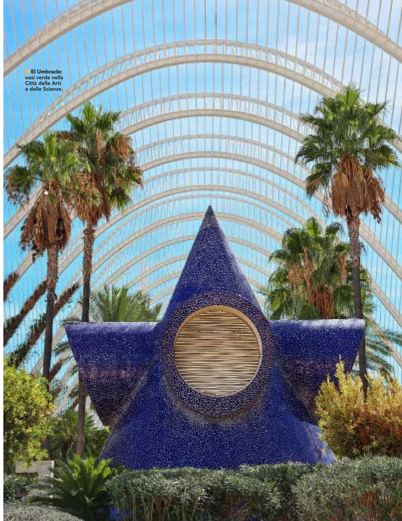
● El Umbracle: oasi verde nella Città delle Arti e delle Scienze.