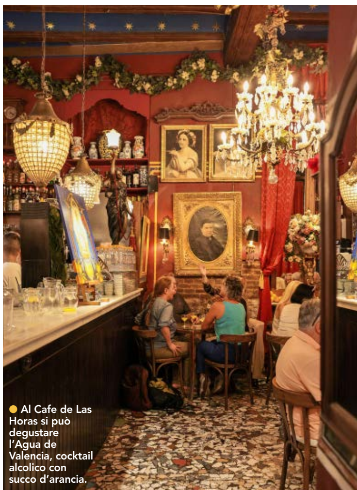
● Al Cafe de Las Horas si può degustare l'Agua de Valencia, cocktail alcolico con succo d'arancia.