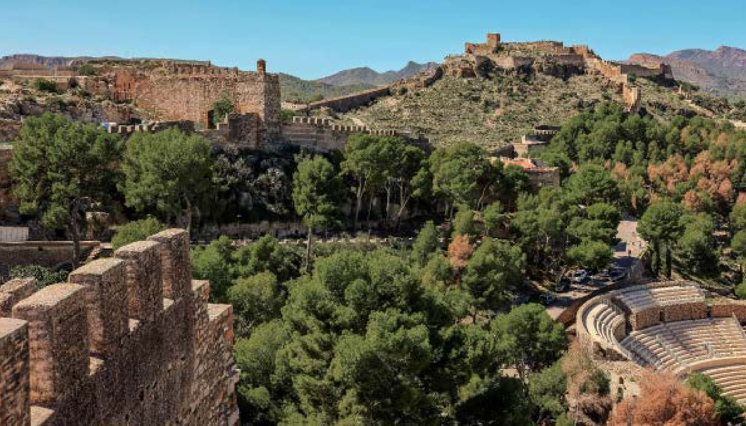
● Sopra, il castello e l'anfiteatro di Sagunto. Sotto da sinistra, il Centro de arte Hortensia Herrero a Valencia; uno scorcio del quartiere del Cabanyal; la paella alla valenciana del ristorante La Sucursal (lg: lasucursal_restaurante).

Verde, in cuor suo, Valencia lo è dagli anni Settanta, quando nacque il gruppo di azione civica “El llit del Turia és nostre i el volem verd” (il letto è nostro e lo vogliamo verde). Il grande fiume Turia che sfociava nel Mar Mediterraneo, sulle cui sponde i Romani avevano edificato la città, continuava a esondare. Così dopo la terribile alluvione del 1957 si decise di deviarlo. Il dittatore Francisco Franco pensava di stendere sul suo letto un'autostrada a quattro corsie, che connettesse il porto valenciano alla capitale Madrid. Ma la popolazione si oppose, tanto che i 110 ettari sottratti all'acqua fluviale non vennero mai ricoperti di asfalto. Negli anni Ottanta, in tempi di democrazia, la giunta iniziò a sostenere la “riforma verde”, e nel 1986 venne inaugurato il più grande parco urbano di Spagna, quello del Turia, oggi fra i più vasti d'Europa. Pulitissimo, silenzioso, pieno di attrazioni, oasi felice tra palme e prati all'inglese.