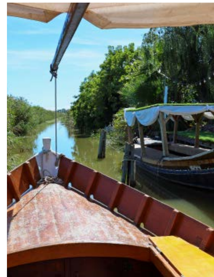
● Sopra da sinistra, un tratto della Via Verde fra Caudiel e Segorbe, dove pedalare immersi nella natura; imbarcazioni tradizionali, ma con motore elettrico, sul lago del Parco naturale dell'Albufera, paradiso del birdwatching. A fianco, le bellissime cascate naturali Salto de la Novia, a Navajas.

passato arabo, dove l'alternarsi di "moros y cristianos" è tangibile e le tradizioni legate al mondo agropastorale ben vive, tra corse di tori e sfilate di cavalli nei centri storici.