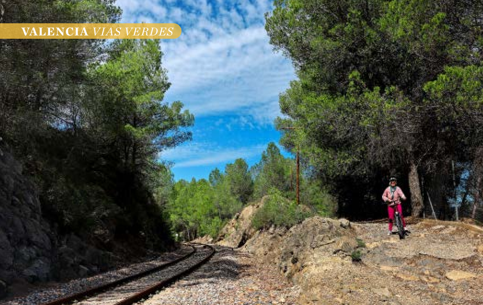
● I 10 chilometri della Via Verde fra i borghi di Jerica e Navajas sono immersi nella natura, "abbracciati" dai boschi.