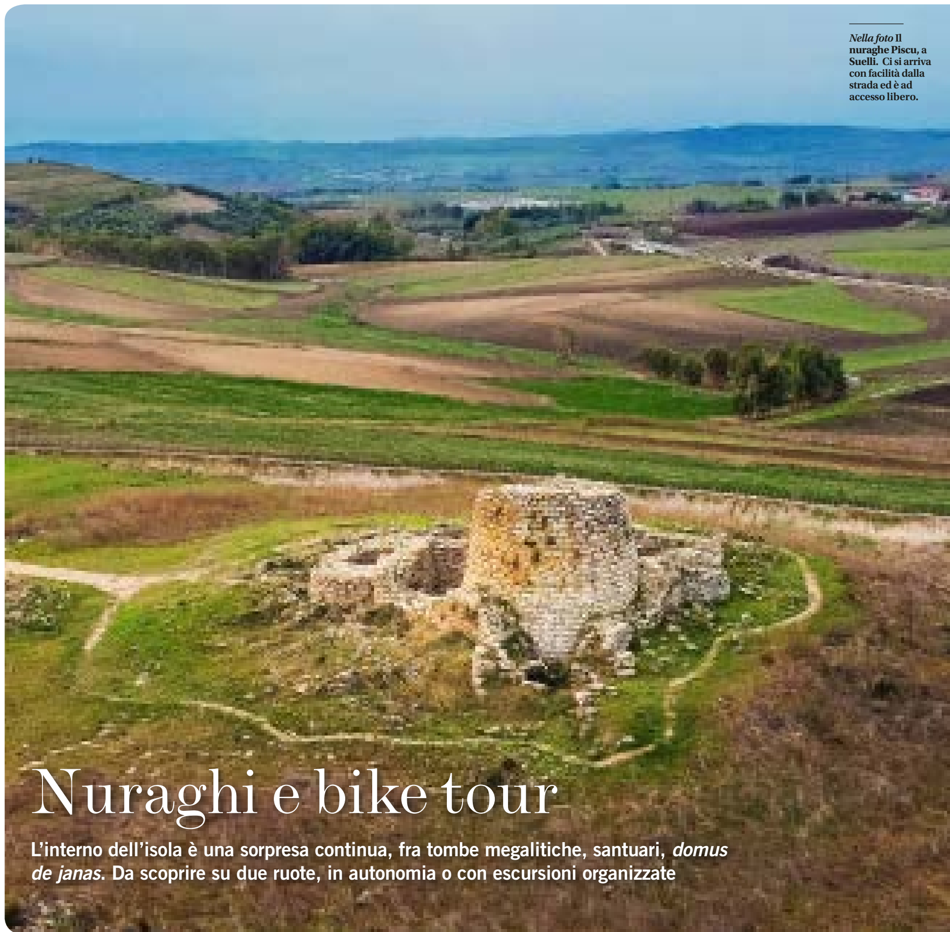
Nella foto il nuraghe Piscu, a Suelli. Ci si arriva con facilità dalla strada ed è ad accesso libero.