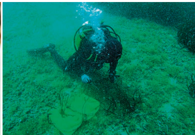
● A sinistra, un pesce pulitore , un esemplare della ricca varietà che popola le acque di Villasimius. A destra, il ripristino di praterie di posidonia oceanica nei fondali dell’area marina protetta di Capo Carbonara . In alto, Porto Sa Ruxi , dove praticare yoga, barefoot e un “bagno” tra i ginepri secolari.