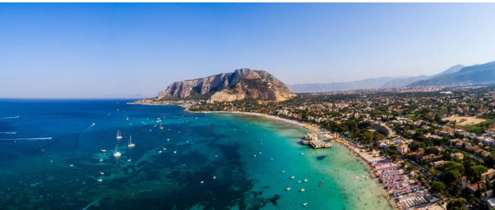
Una veduta del golfo di Palermo. Molte le spiagge attrezzate fino alla fine dell'estate.